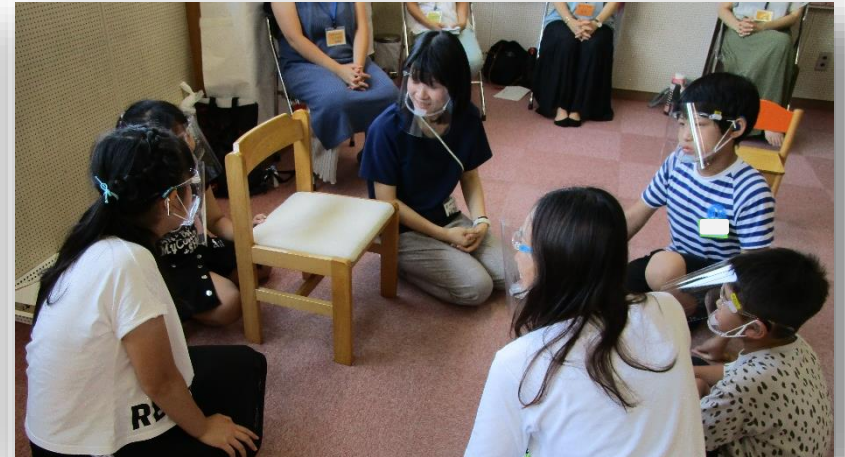
ゲームでの話合い

7月19日（月）に、難聴グループの全体交流会「思い出にのこるように 1年生と楽しもう会」を行いました。今年度は新たに1年生を迎え、楽しい会ができるように、5、6年生が全体交流会を計画・準備し、当日の運営も意欲的に取り組みました。