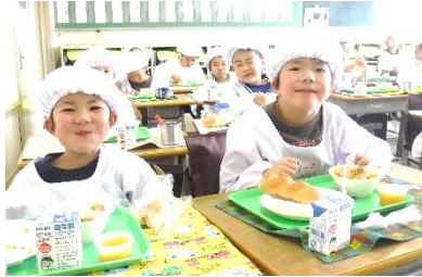
4 月 18 日 (水) の給食