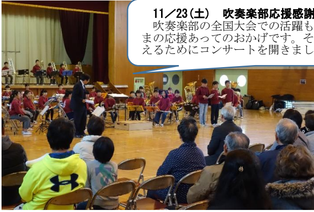
とどけよう わたしたちのハーモニー ～大宮南小学校 校内音楽会～

11/23(土) 吹奏楽部応援感謝コンサート 吹奏楽部の全国大会での活躍も地域や保護者の皆さまの応援あってのおかげです。そのお礼の気持ちを伝えるためにコンサートを開きました。